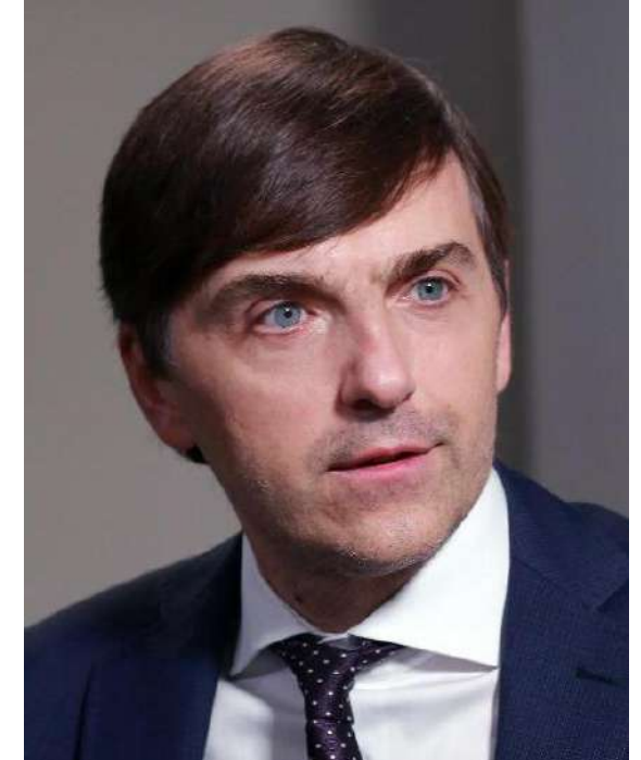
Министр просвещения РФ Сергей Кравцов