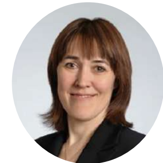
Замглавы Минобрнауки России Петрова О.В.

Реализуемая система федеральных инновационных площадок Минобрнауки России сегодня оказывает всестороннюю поддержку педагогическому сообществу – реализуемая инновационная площадка выступает организатором профессиональных конкурсов и мероприятий, разрабатывает педагогические учебники и пособия, оказывает информационную, правовую, методическую и информационную поддержку работникам образования и реализует и иные важные задачи в системе образования.