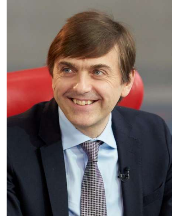
Министр просвещения РФ Сергей Кравцов

Следующее направление – современная инфраструктура, созданная в том числе в рамках национального проекта «Образование». Строятся и ремонтируются школы и детские сады, в также открыты 79 региональных центров, работающих по модели «Сириус», открыто более 250 центров «IT-куб», 365 технопарков-кванториумов, а также более 17 тысяч центров образования цифрового, естественнонаучного, технического, гуманитарного профиля «Точки роста».